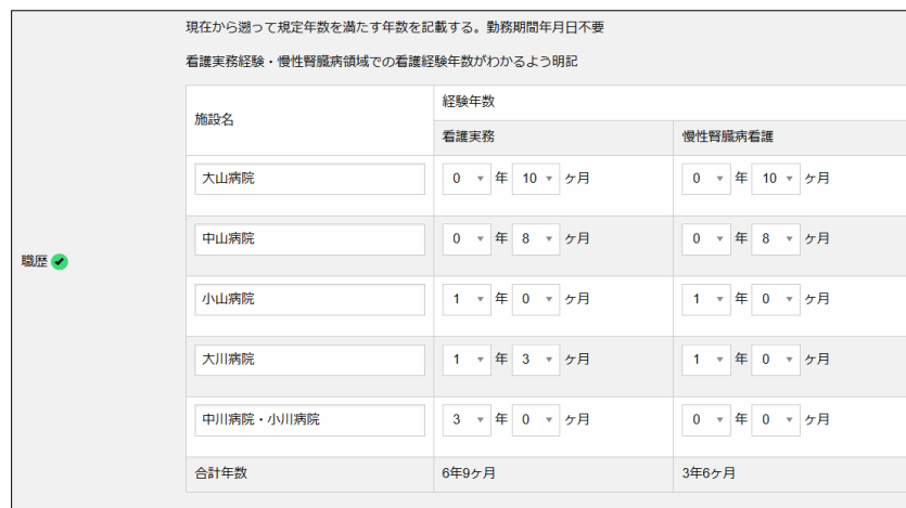
図 7 職歴入力欄

図 7 は職歴欄の記入例です。CKDLN の受験申請には看護師実務経験 5 年、慢性腎臓病看護の実務経験 3 年が必要です。その基準を満たすまで、職歴の最近のものから遡って実務経験年月を記入していきます。記入欄が 5 つで足りない場合には 5 つ目の欄に複数の施設を併記し、それらの施設での合計年数を年数欄に記入します。図 7 の例では 6 施設の合計で実務経験基準を満たしていますので、「履歴」の横の✓マークが緑色に変化しています(未記入時は赤色)。