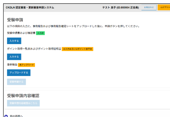
図 8 受験申請書および履歴書入力完了した状態

保存された後に申請のメイン画面に戻ると、図 8 のように受験申請書および履歴書が「入力済」として緑色の表示に変わっています。これで、受験申請書および履歴書の入力については完了しましたので、ポイント登録、及び事例報告のアップロードを行うことで受験申請が完了します。